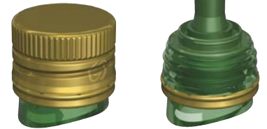
Guala Closures – VERSO

Bu alüminyum kapağın açılması ve tekrar kapanması çok kolaydır. Çok çeşitli süsleme seçenekleriyle isteğe göre uyarlanabilir. Patentli bir damla kurtarma sistemi, istenmeyen damlaları orijinal bir akış kesici konseptiyle durdurur ve ayrıca kapağın temiz ve hijyenik kalmasını garantiler.