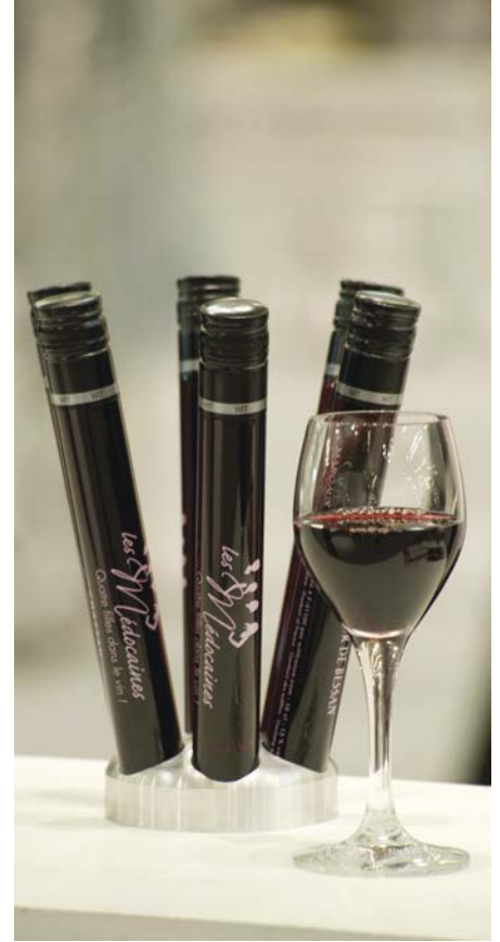
Guala Closures – WIT – Wine in Tube

WIT veya Wine in Tube, Guala Closures tarafından, kaliteli şaraplar için yeni bir paketleme konsepti olarak geliştirilmiştir ve hakemlerin söylediğine göre "malzemelerin – bu durumda cam ve alüminyum – tamamen orijinal bir şekilde karıştırılmasıyla" elde edilmiştir.