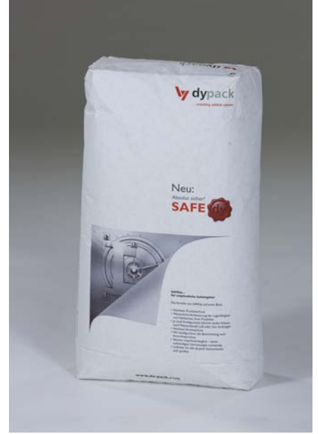
Gascogne Laminates ve dy-pack Verpackungen – SAFE Ely

Perforasyon sistemi ve kağıt tabakalar için yenilikçi bir üst üste bindirme tekniğiyle bir araya getirildiğinde, içerideki malzemenin çok yüksek seviyede korunması ve daha uzun süre sabitlenmesi mümkün hale geliyor. Alufoil neme, havaya veya gaza karşı çok etkin bir engel oluşturuyor ve aynı zamanda çok çeşitli kuru ürünlerin kokularını ideal seviyede tutuyor. ///