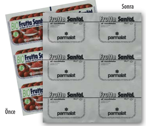
Rotoprint Sovrastampa – Frutta al cucchiaio Parmalat

larını azaltılmasına yardım eder ve hammaddeden başlayarak yeniden ambalaj malzemesi üretmeye gerek yoktur. ///