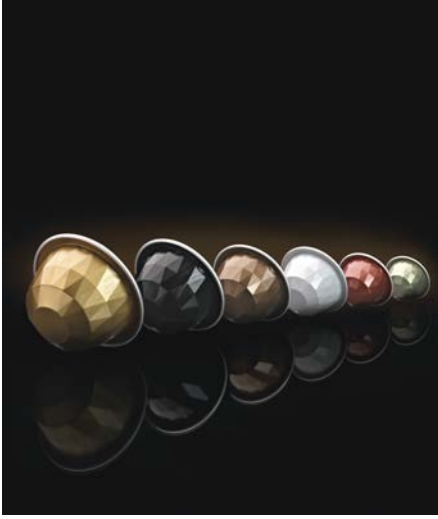
Amcor Flexibles – Belmoca

İçecek üreticisi Belmoca, beş çeşit seçkin kahvenin yanı sıra, sütü Amcor Flexibles malzemesiyle yaratılan parlak, elmas kesimli, alüminyum kapsüllerle paketleniyor. Bu, ödülü vermekte hiçbir tereddüt duymayan hakemleri etkiledi.