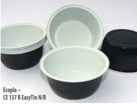
Ecopla – CE 137 R EasyTin N/B

Hamur işi tatlı çeşitlerini paketlemek için kullanılan kase, bir vinilik kapakla birlikte siyah ve beyaz PET lak içeriyor. Ecopla, yeni bir alaşımın tavlama işleminde daha sert bir kondüsyona ulaştığını, bunun da rijiditeye yardımcı olduğunu ifade ediyor. Sonuçta, standart ölçekteki kaselerden %17 oranında daha ince ve %16 oranında daha hafif, aynı zamanda daha iyi mekanik özellikler sunan bir malzeme ortaya çıktığını iddia ediyor. ///