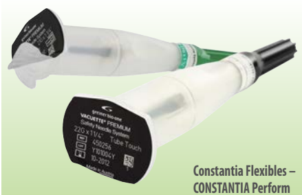
Constantia Flexibles – CONSTANTIA Perform

Bu üst kapama folyosu lazerle işaretlenmiş olabilir ve aşınmaya dayanıklı bir üst lak kullanır. Constantia folyonun tüpte iplikçikler olmadan kolay ve temiz