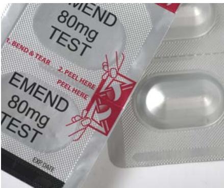
Amcor Flexibles – Soyulabilir kapaklı EMEND® Tri-Pack Formpack®

Bu blister, hastanın, tableti iterek kapak folyosunu