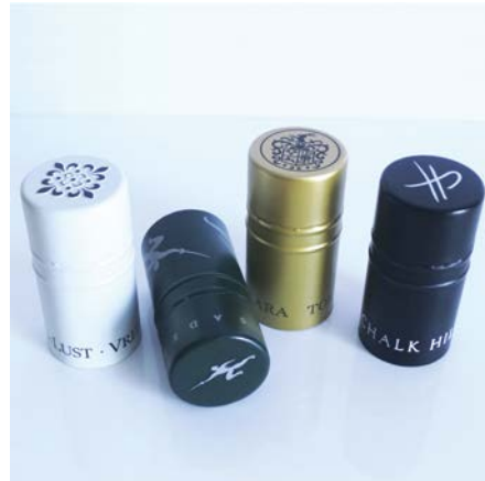
Guala Closures – SAVIN PREMIUM

Kapağa çeşitli yüzey uygulamaları yapılabilir: mat, metalik, saten veya parlak. En üstteki süsleme, baskı/folyolama veya kabartma yoluyla yapılabilir. Şaraplar ve alkollü içkiler için birçok çeşitli ebatlar mevcuttur. ///