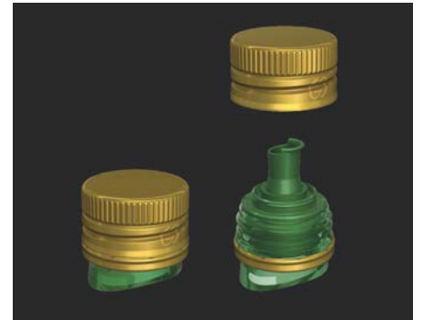
Guala Closures – VERSO

Standart zeytinyağı şişeleri için özel olarak vidalı kapak olarak geliştirilen VERSO , yağ akışkanlığına