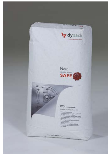
Gascogne Laminates e dy-pack Verpackungen – SAFEdy

Grazie alla combinazione di un sistema di perforazione con una tecnica innovativa di sovrapposizione per gli strati di carta è stato raggiunto un ottimo livello di protezione del prodotto e di stabilità. Il foglio costituisce una barriera efficace contro umidità, aria o gas e mantiene gli odori all'interno – davvero l'ideale per moltissimi prodotti secchi. ///