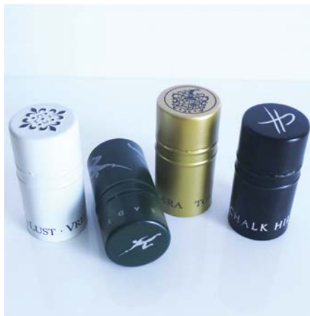
Guala Closures – SAVIN PREMIUM

La capsula interna in alluminio con filetto integrato è adatta alle bottiglie di vetro standard e migliora molto l'aspetto della chiusura, dato che il filetto è invisibile dall'esterno. L'ampia superficie esterna è l'ideale per una decorazione/rivestimento anche sui lati e per la goffatura.