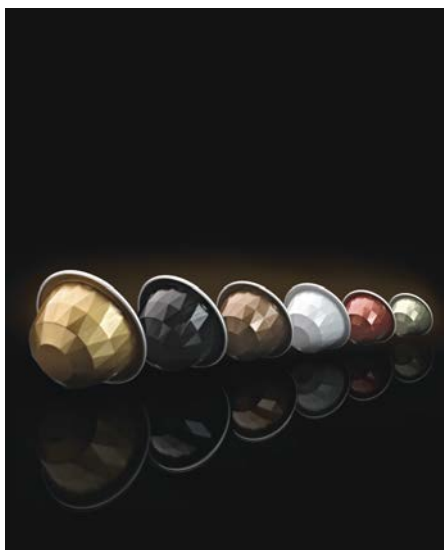
Ancor Flexibles – Belmoca

Il produttore di bevande Belmoca confeziona cinque varianti di caffè di ottima qualità e una porzione di latte in capsule di alluminio brillanti a forma di diamante create con il materiale di Ancor Flexibles che hanno impressionato i giudici al punto che il premio è stato assegnato senza esitazioni.