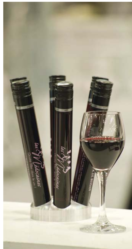
Guala Closures – WIT – Wine in Tube

Il WIT, Wine in Tube, è stato sviluppato da Guala Closures come nuovo concetto di packaging per vini di qualità. La giuria l'ha definito un' “originalissima fusione di materiali”, in questo caso vetro e alluminio.