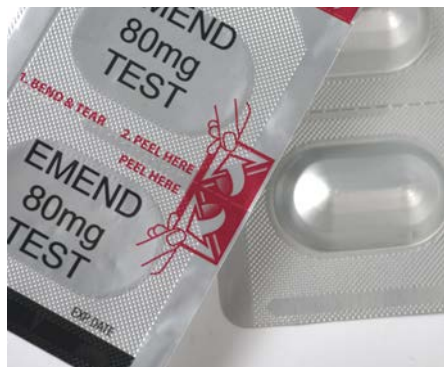
Ancor Flexibles – EMEND® Tri-Pack Formpack® con copertura pelabile

Il beccuccio brevettato VERSO, creato e prodotto da Guala Closures , è incorporato in una chiusura in alluminio. Quando la bottiglia viene aperta il beccuccio si alza, permettendo di versare velocemente il prodotto e di controllarne il dosaggio, qualità che gli sono valse un Trophy in questa categoria.