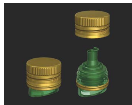
Guala Closures – VERSO

Sviluppato appositamente come chiusura a vite per