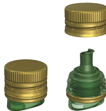
Guala Closures – VERSO

La chiusura in alluminio, facile da aprire e da richiudere, può essere personalizzata grazie a diverse soluzioni per la decorazione. Un sistema brevettato con un originale concetto taglia goccia previene colature indesiderate e mantiene pulito il dosatore.