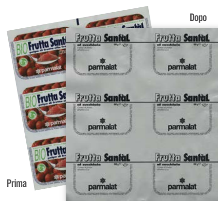
Rotoprint Sovrastampa – Frutta al cucchiaio Parmalat

vecchio non viene distrutto e di evitare la produzione di una nuova bobina da materiale vergine. ///