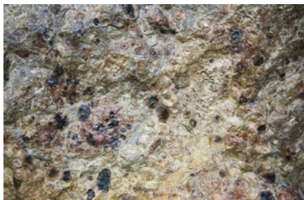
Vue d'un énorme bloc rocheux de bauxite

Les procédés découverts par Bayer, puis simultanément par Hall et Heroult, pour d'abord extraire l'alumine de la bauxite puis pour la raffiner de façon à obtenir des quantités commerciales, ont finalement débouché sur l'industrie moderne et sur l'usage aujourd'hui généralisé de l'aluminium sous toutes ses formes, et notamment sous la forme de feuille d'aluminium. Avec une part de 8 %, l'aluminium est le métal le plus abondant dans la croûte terrestre, offrant des réserves très importantes. Le minerai initial de