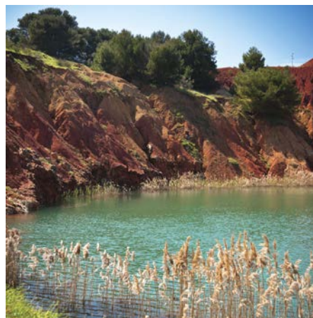
Cette ancienne carrière de bauxite, abandonnée dans les années 1970, a désormais fait place à un lac, dans la magnifique baie Orte à Otrante en Italie

La majorité de la bauxite étant exploitée à ciel ouvert, l'industrie a adopté un programme de gouvernance très rigoureux de façon à faire en sorte que les mines soient réhabilitées et à avoir un impact zéro sur le nombre de sites concernés dans le monde entier. Le dernier Alumina Technology Roadmap (Programme Technologique de l'Alumine) publié en 2010 par l'IAI, précise : « Les efforts doivent être poursuivis pour réduire l'utilisation d'eau, augmenter le recyclage et utiliser de l'eau de qualité moindre. L'utilisation d'eau douce doit être réduite à zéro. Des objectifs précis ont également été définis pour la réutilisation d'autres déchets et produits de résidu, pour l'amélioration des technologies de raffinage et d'extraction et une production écoénergétique. ///