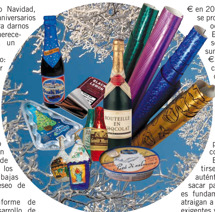
Más sobre estos artículos de lujo de aluminio en el interior.

Se calcula que las ventas de alimentos y bebidas alcanzarán los 106.400 millones de € en 2009. Las ventas de cuidados personales especializados también suben y podrían superar los 5.800 millones de