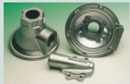
Metamorfosi: l'imballaggio di alluminio usato ieri è diventato oggi un componente di veicoli.

I prodotti durevoli di alta qualità quali quelli fabbricati con i rifiuti di prodotti al consumo, con breve ciclo vitale, hanno dimostrato che l'alluminio ha una riciclabilità eccezionale. In questo contesto i materiali di imballaggio che contengono l'alluminio hanno dimostrato che sono "materiali per eccellenza" e rispettano le richieste governative che riguardano l'alta riciclabilità dei materiali di imballaggio e sostengono la conservazione delle risorse.