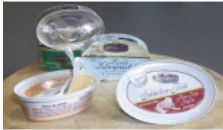
Vecchio e nuovo. Aperture più semplici e di solo un terzo del peso complessivo del materiale da imballaggio

Il nuovo imballaggio è costituito da una base di lattina in alluminio di 180µm fabbricato da Impress Metal Packaging con una lacca all'interno e un design di stampa offset all'esterno. Il materiale del