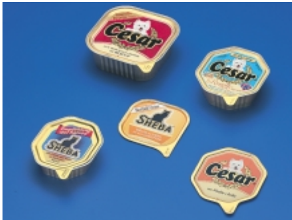
Presentazione di prodotti di prima qualità

Questo intenso lavoro di sviluppo è stato basato sulla convinzione che l'industria del foglio di alluminio può offrire una maggiore leggerezza di peso, un'alta efficienza di costo e un imballaggio eco-compatibile, di gran lunga superiori a